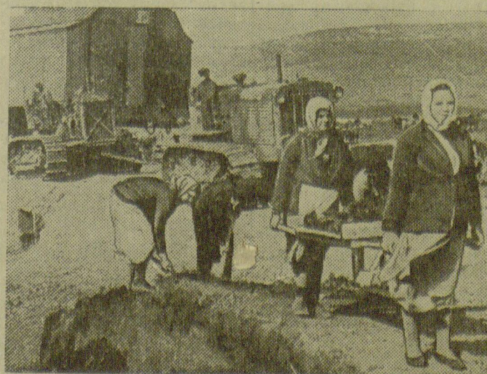
На участке № 9. Колхозницы сельхозартели им. Буденного, Старо-Марьевского района, за работой на трассе канала.

Стахановскими темпами работают колхозники сельхозартели им. XVIII съезда партии тт. Брилев, Белевцев и Буняев. 11 мая они ушли в ряды доблестной Красной Армии, ознаменовав этот день стахановской работой. Каждый из них перевыполнил норму в четыре раза. Д. Лабинцев.